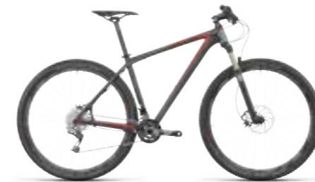
ELITE SUPER HPC SLT 29