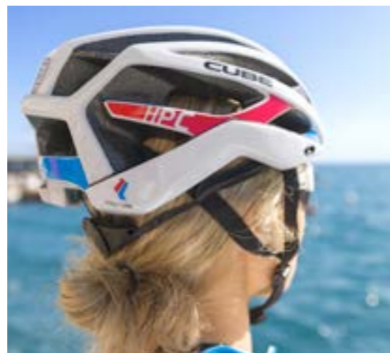
HPC TEAMLINE HELMET

AXIAL WLS – light weight bikes with innovative technology. The carbon fiber frames of the Axial WLS are lightweight and stiff owning the genes of the high end road bikes of the Litening series. The Ready For Race Geometry (RFR) enables a sporty but not too stretched out riding position allowing long training rides or races without compromising the female comfort.