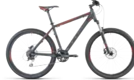
AIM DISC 26