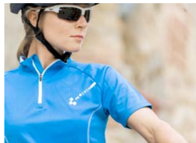
MOTION LINE WEAR