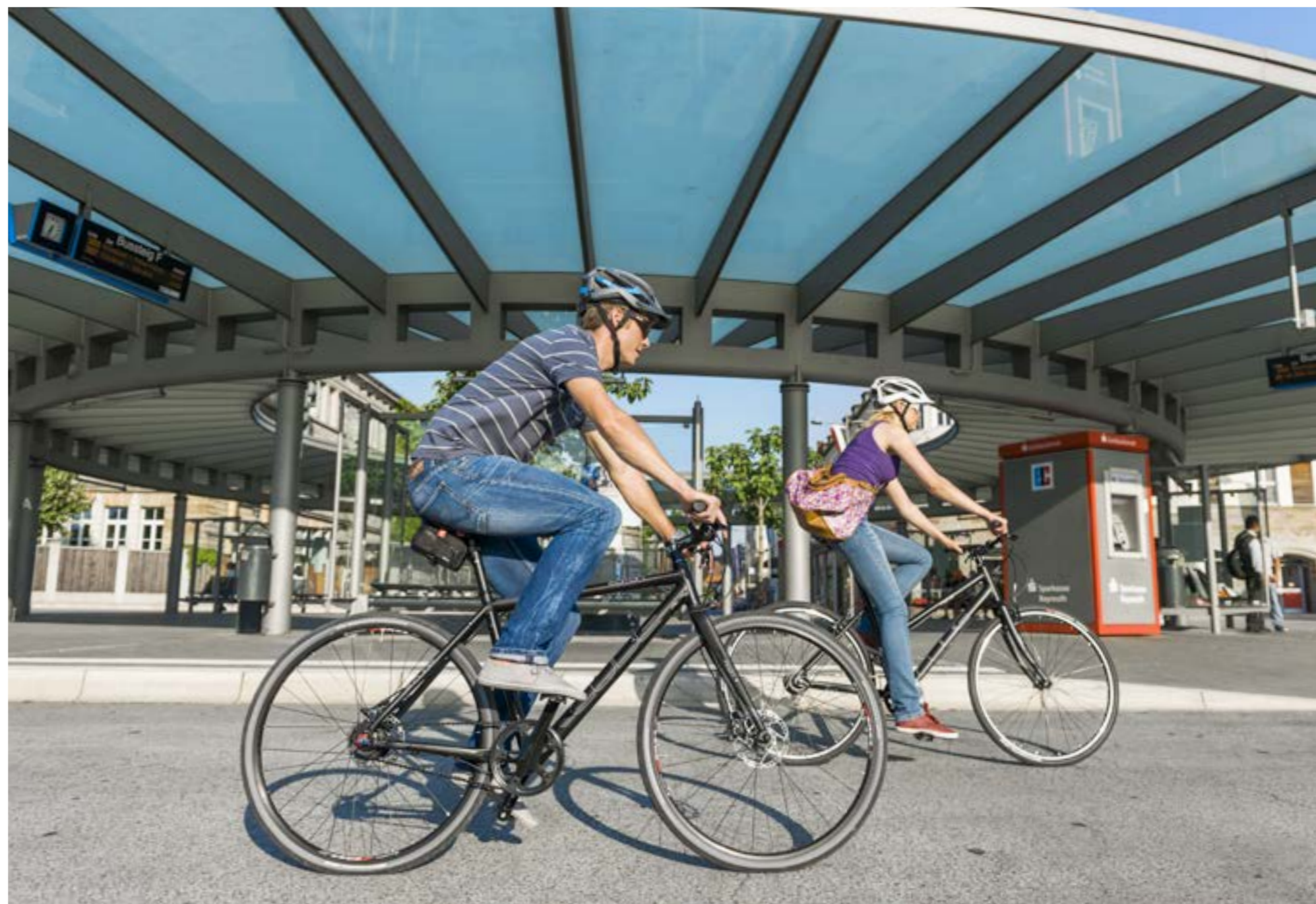
EDITOR / HYDE PRO

Style und Speed in perfekter Kombination. Die Urban Life Series bringt neben Understatement und gutem Aussehen alle Vorteile der individuellen urbanen Mobilität mit. Du kommst schneller genau an dein Ziel. Keine Parkplatzsuche, kein Stau, kein Stress.