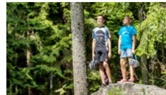
KIDS TEAMLINE WEAR