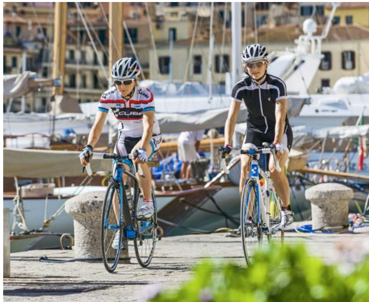
AXIAL WLS GTC SL / AXIAL WLS