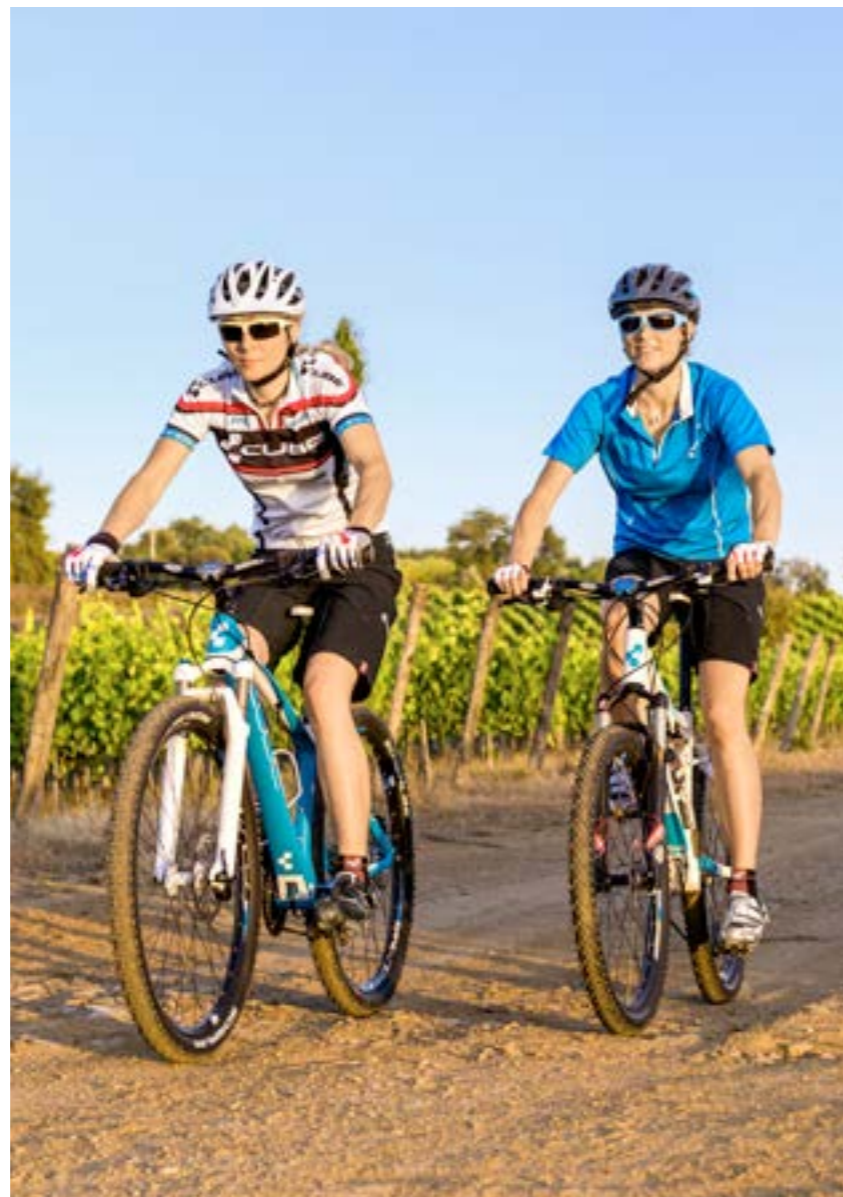
ACCESS WLS GTE 29 / AMS WLS