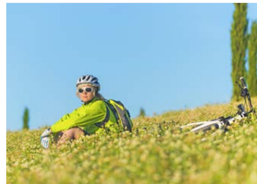
PRO WIND JACKET