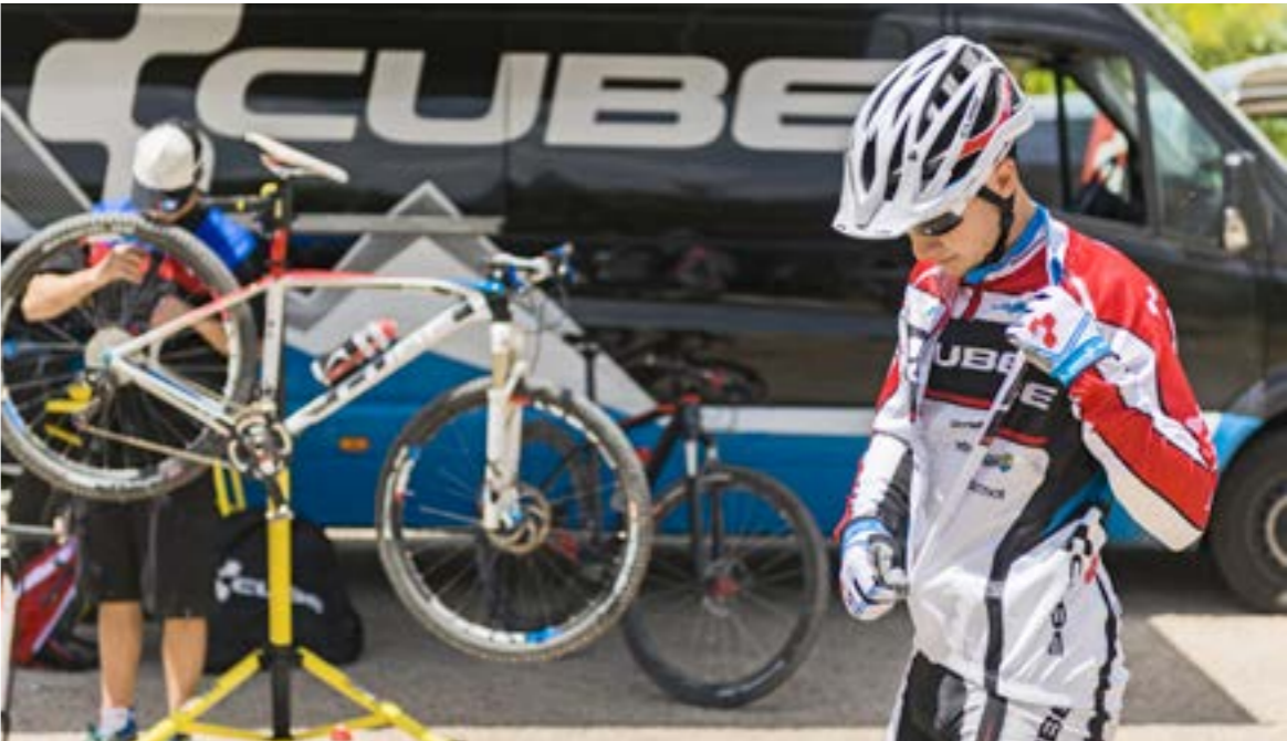
ELITE SUPER HPC

Race proven. There are a lot of advantages testing a mountainbike inhouse in our test laboratory. But out in the field while racing anything can happen. This is why our team riders compete on original CUBE bikes. Whether it is a super tough XC race with steep climbs to check the frame stiffness or an epic marathon where anything can happen and the material gets hour long beating. Nothing tops the experience of our human test machines.