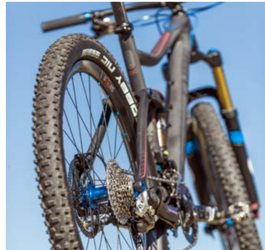
EFFICIENT TRAIL CONTROL