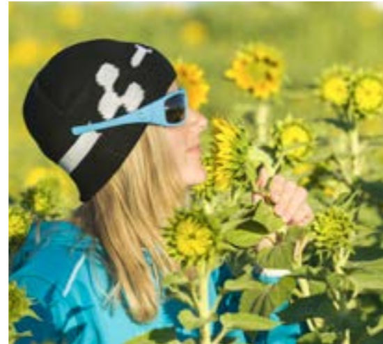
CUBE WLS CLOTHING

Woman Fashion with Natural Fit. A lot of our female CUBE staff are riding their bikes, on the road or offroad. They want to have the right clothing adapted to their needs. We look for the right materials and the right female fitting. With the newly developed concept Natural Fit the ergonomics hence the comfort is improved where it is needed. At the contact points like handlebar and saddle.