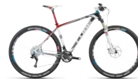
ELITE SUPER HPC RACE 29