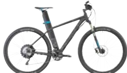
EPO 45 REACTION PRO 29