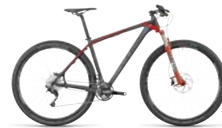
REACTION GTC SL 29