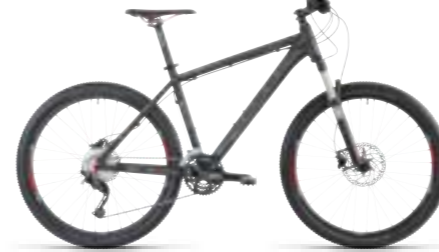
LTD RACE 26