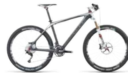
ELITE SUPER HPC 26