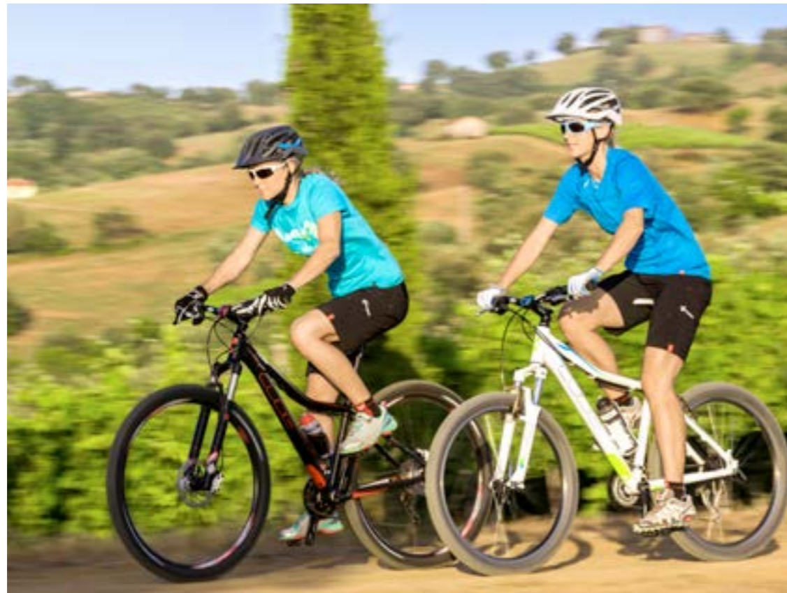
ACCESS WLS RACE 29 / ACCESS WLS