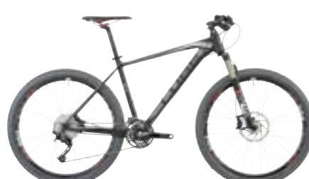
REACTION RACE 26