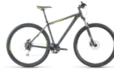
AIM DISC 29