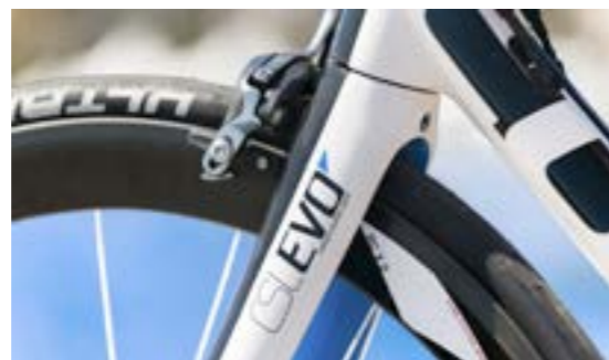
CSL EVO CARBON SUPERLITE FORK