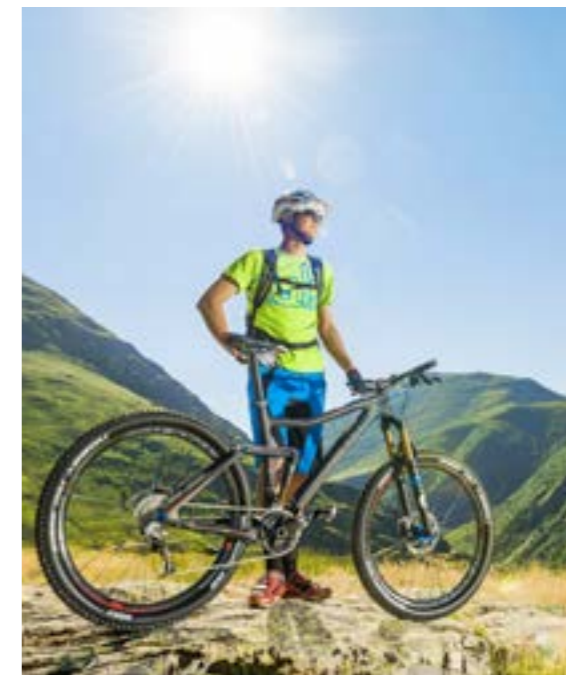
STEREO SUPER HPC 160 SLT