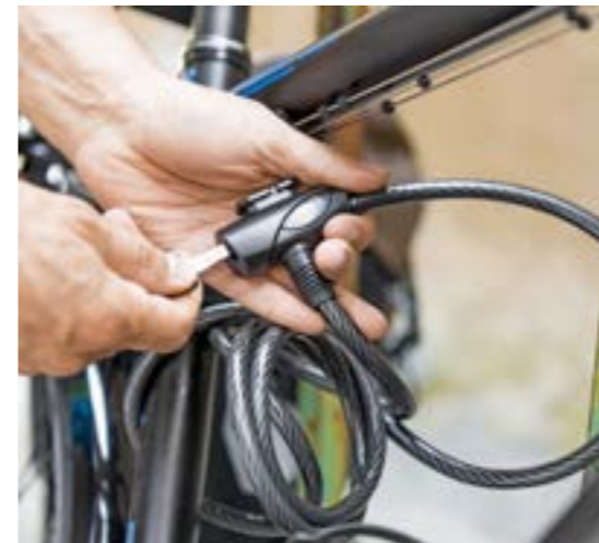
RFR SPIRAL LOCK