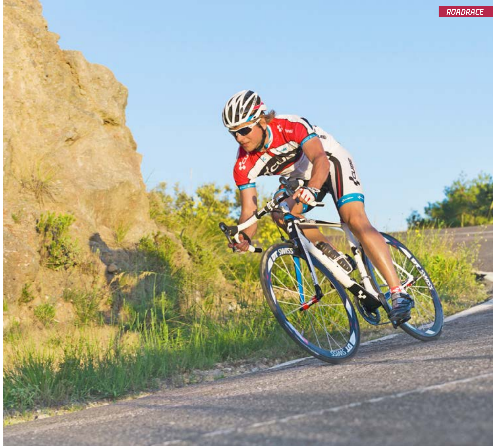
LITENING SUPER HPC SL