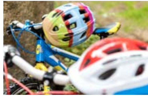
CUBE KIDS HELMET