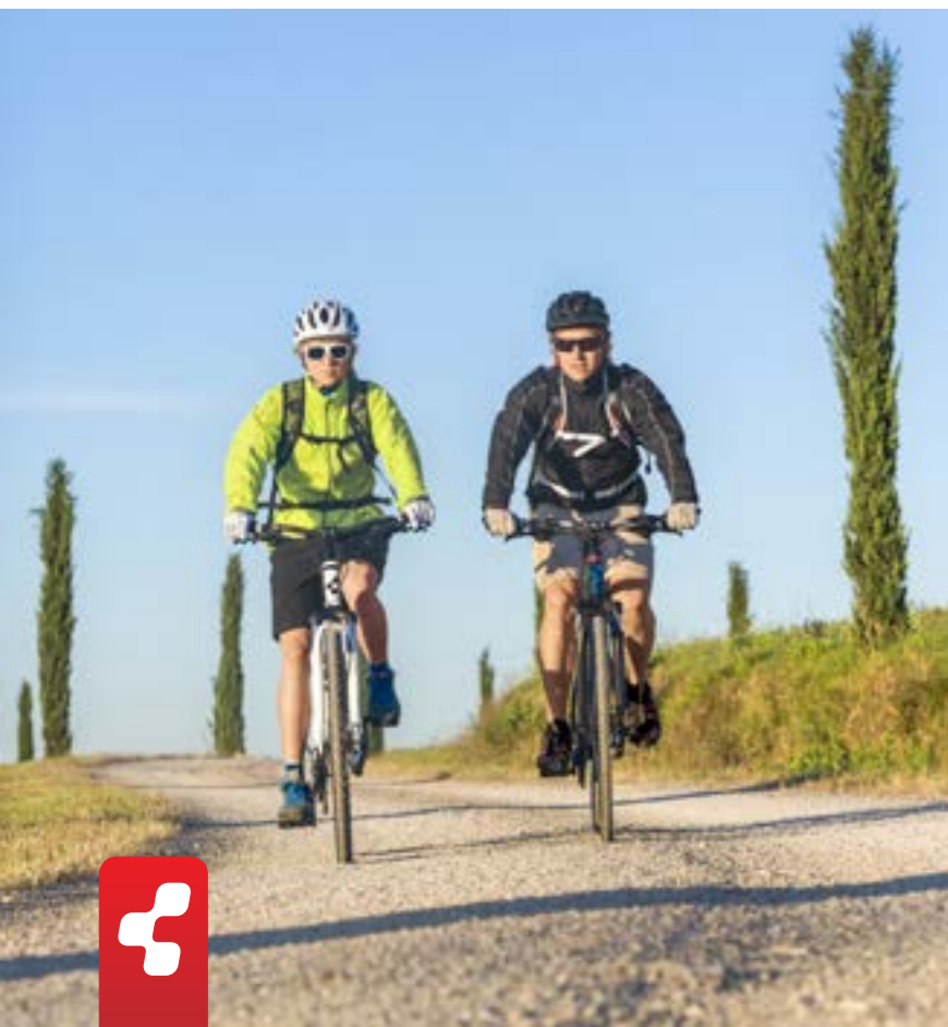
CURVE PRO / NATURE PRO