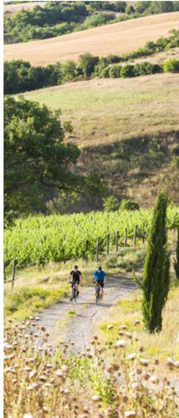
MOTION LINE / BLACK LINE WAER