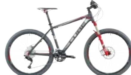
LTD PRO 26