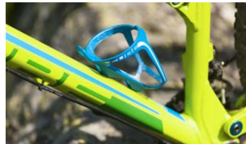
CUBE HPP BOTTLE CAGE