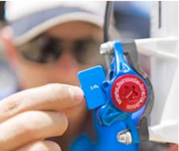
CUBE BRAKE PADS