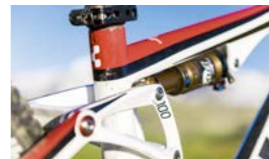
AMS 100 SUPER HPC SL 29