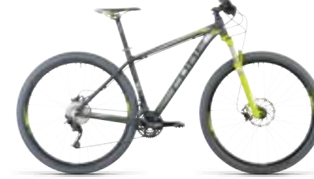
LTD RACE 29