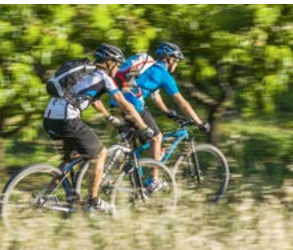
REACTION GTC SL 29