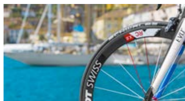
LITENING SUPER HPC PRO

CSL EVO Vollcarbon-Gabel für Komfort und Gewichtsersparnis. In unseren Litening-Rahmen ist die CSL EVO Vollcarbon-Gabel verbaut. Jeder Millimeter besteht aus Kohlefasern, selbst der Schaft. Dies sorgt für hohe Lenkpräzision, geringes Gewicht und beschert dem Rad optimale Steifigkeits-zu-Gewichtswerte (STW).