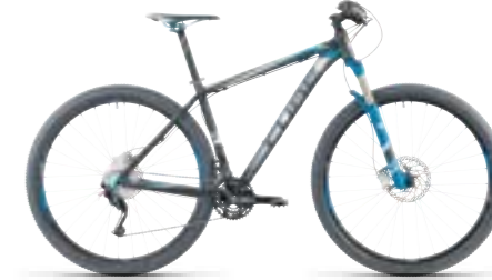
LTD PRO 29