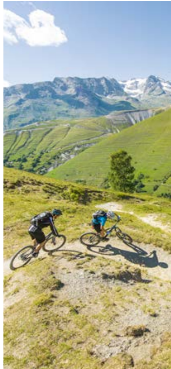
STEREO SUPER HPC 160 SLT / STEREO SUPER HPC 140 SLT