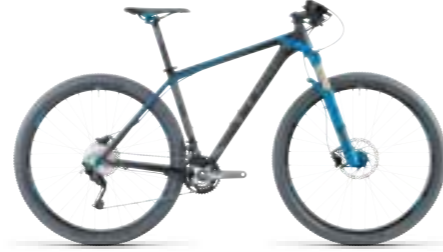
REACTION GTC PRO 29