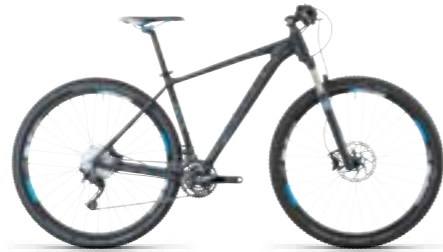
REACTION SL 29