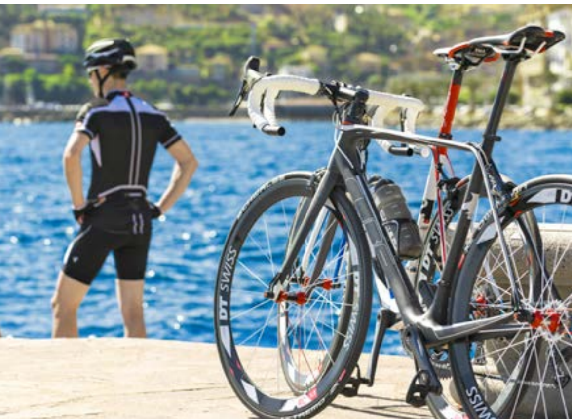
LITENING SUPER HPC PRO