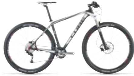
REACTION GTC RACE 29