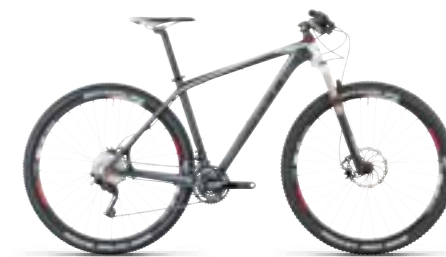
ELITE SUPER HPC PRO 29