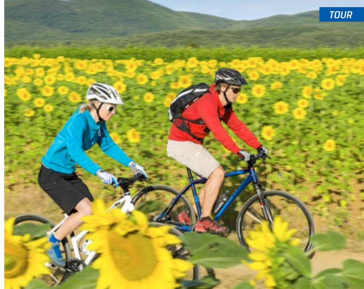
HPC HELMET / AMS 11 BLACKLINE BACKPACK

Comfort starts at point zero. Where the tires hit the ground you can start reducing vibrations and shocks. Together with the renowned german company Schwalbe CUBE developed the SMART SAM with the dimension 44x622. A higher and more wider tires with less rolling resistance.