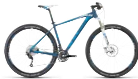
REACTION PRO 29