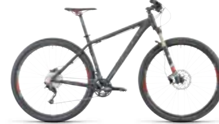
LTD PRO 29