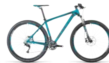
REACTION GTC SL 29