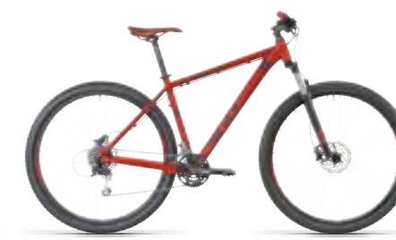
AIM DISC 29