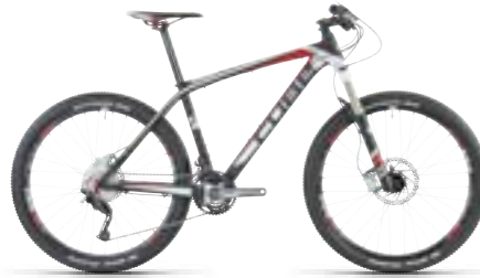
REACTION GTC PRO 26