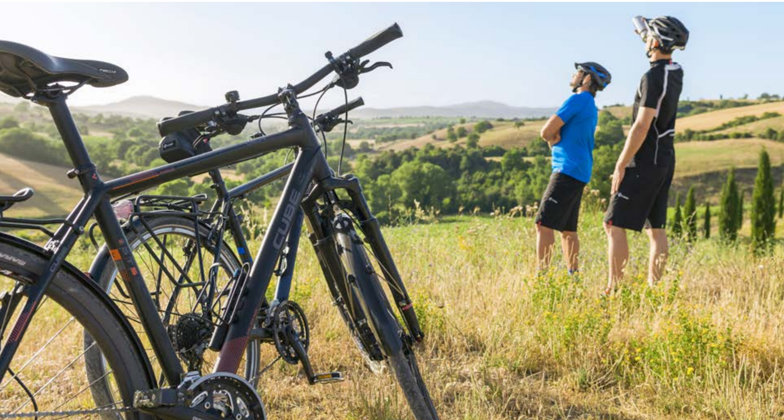
DELHI PRO / TRAVEL PRO