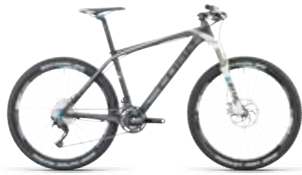
REACTION GTC SL 26